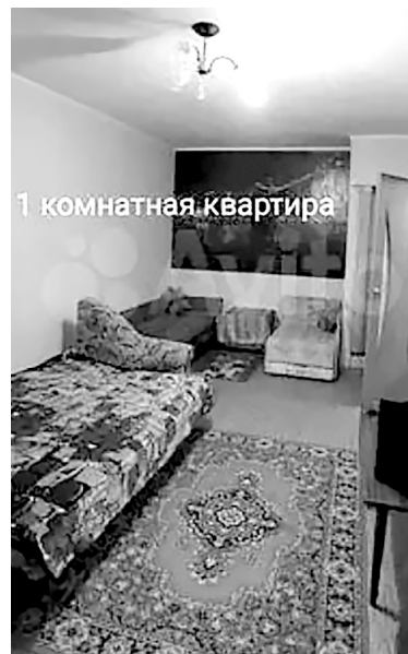
1 комнатная квартира

посмотрела, какая квартира здесь была, если бы не было военных. Каким трудом они зарабатывают эти деньги, никто об этом не думает. Зато